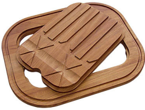
Planche de découpe Twin en bois Iroko 8644 003